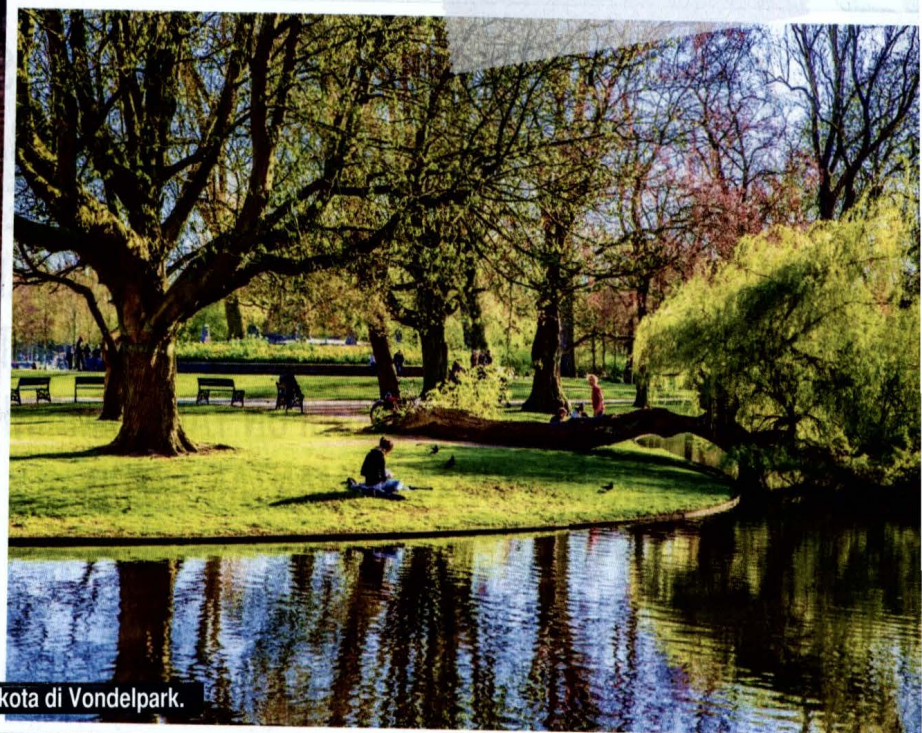
Taman kota di Vondelpark.

dari situ ada kedai kopi di tepi air, sekira mereka mahu berlama-lama.