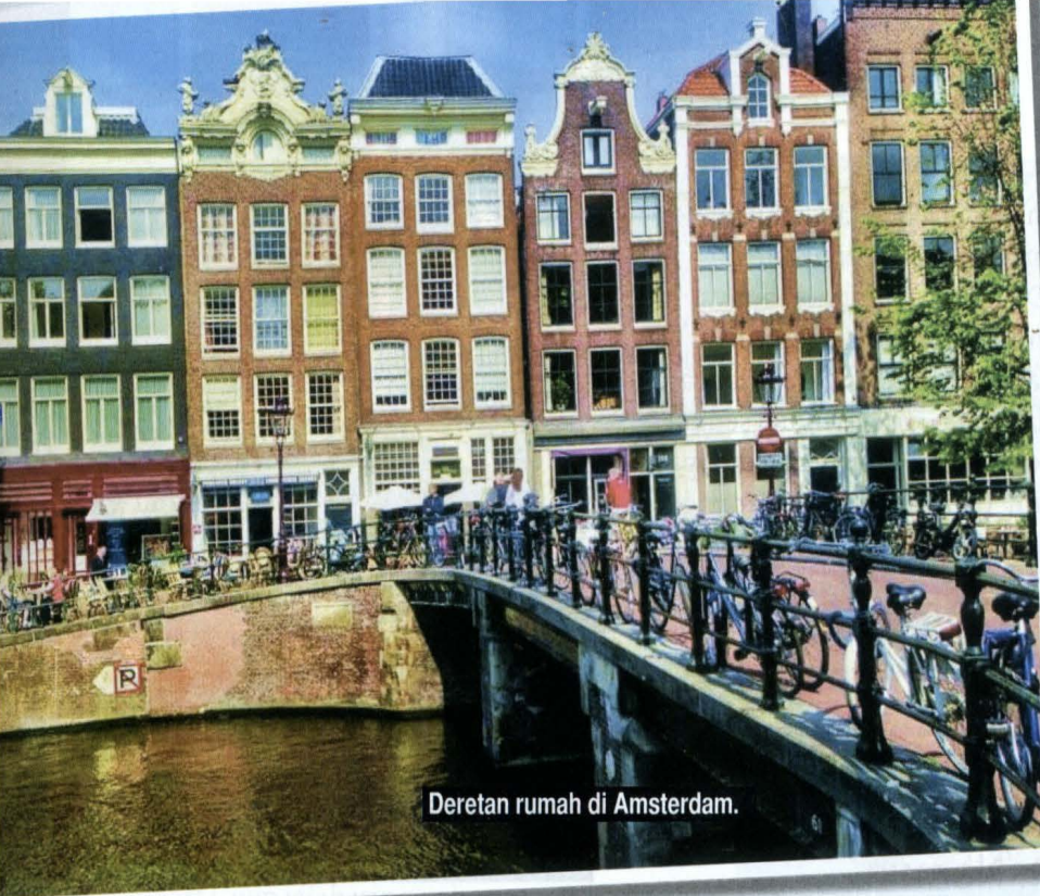
Deretan rumah di Amsterdam.

Kereta api itu membawa kita ke Central Station Amsterdam. Awas banyak penyeluk saku di sini! Dari sinilah jalan-jalannya akan mengarah ke subbandar kota besarnya. Jalan lurus di depan stesen yang menuju ke arah timur membawa kita ke Istana Raja-raja Orange.