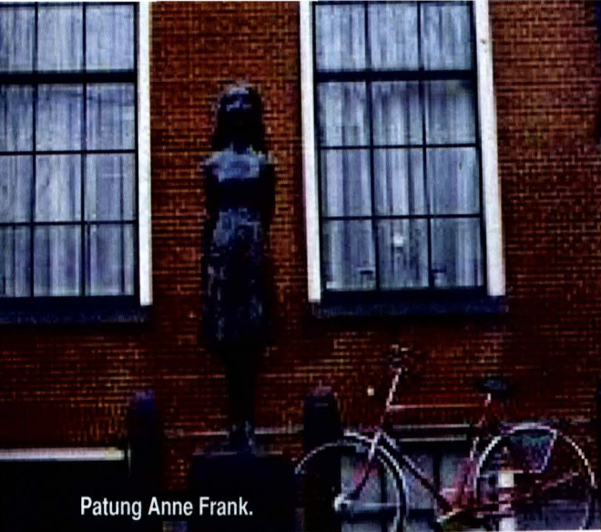
Patung Anne Frank.