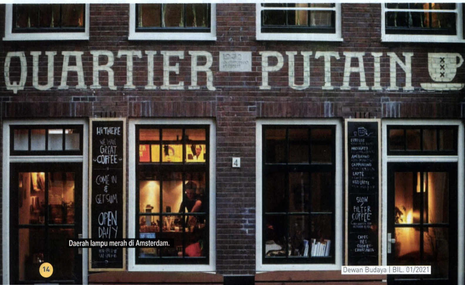
Daerah lampu merah di Amsterdam.

dan petang dan kebiasaannya ada pula pasar hujung minggu yang besar, iaitu pasar raya tradisional mereka. Di sini semua keperluan boleh didapatkan. Pasar-pasar tradisional ini masih dikunjungi ramai penduduk, dan memerikan sebuah ruang di mana mereka dapat bertemu, bertanya khabar dan berguncan. Tidak jauh