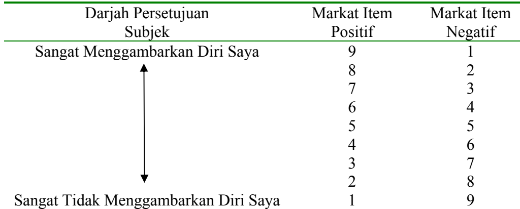
Jadual 2.7: Skala Permarkatan Kebimbangan

Subjek yang mendapat markat yang tinggi iaitu di antara 96 hingga 144 dianggap mempunyai tahap kebimbangan yang tinggi, manakala subjek yang mendapat markat yang rendah iaitu di antara 16 hingga 95 dianggap mempunyai tahap kebimbangan yang rendah.