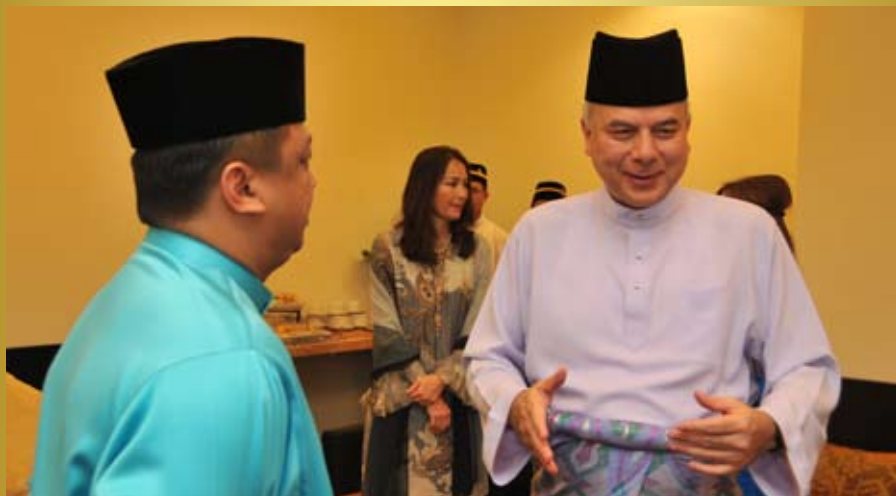
DYMM Pemangku Raja Perak, Tuanku Raja Dr. Nazrin Shah sedang berbicara mesra dengan DYTM Tuanku Syed Faizuddin Putra sebelum Majlis Perasmian SiRaj bermula.