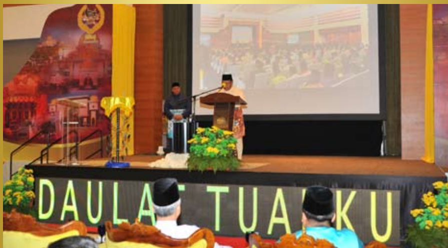
DYMM Tuanku Syed Sirajuddin ibni Al-Marhum Tuanku Syed Putra Jamalullail sedang bertitah dalam Majlis Perasmian Seminar Institusi Raja (SIRaj) di Lanai Kijang, Bank Negara, Kuala Lumpur pada 5 Jun 2013.