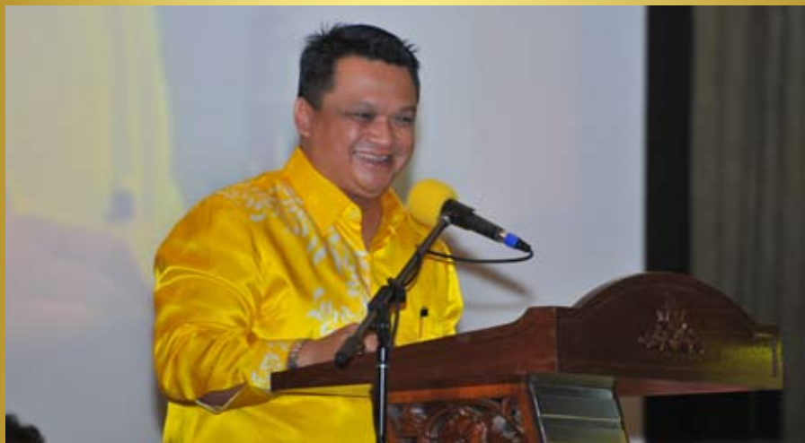
DYTM Tuanku Syed Faizuddin Putra ibni Tuanku Syed Sirajuddin Jamalullail bertitah di Majlis Penutup Seminar Institusi Raja (SIRaj) di Lanai Kijang, Bank Negara, Kuala Lumpur pada 6 Jun 2013.