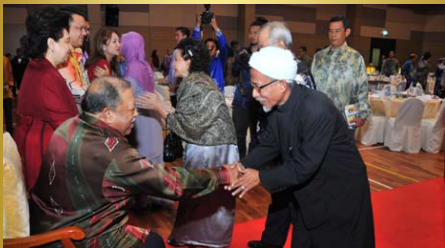
DYMM Tuanku Syed Sirajuddin ibni Al-Marhum Tuanku Syed Putra Jamalullail dan DYMM Tuanku Fauziah binti Tengku Abdul Rashid serta DYTU Tuanku Syed Faizuddin Putra ibni Tuanku Syed Sirajuddin Jamalullail dan DYTU Tuanku Lailatul Shahreen Akashah Khalil berkenan beramah mesra dengan para peserta seminar pada Majlis Santapan Malam sempena Seminar Institusi Raja (SIRaj) di Dewan Tan Sri Mahfuz Khalid, Jabatan Kerja Raya, Kuala Lumpur pada 5 Jun 2013.