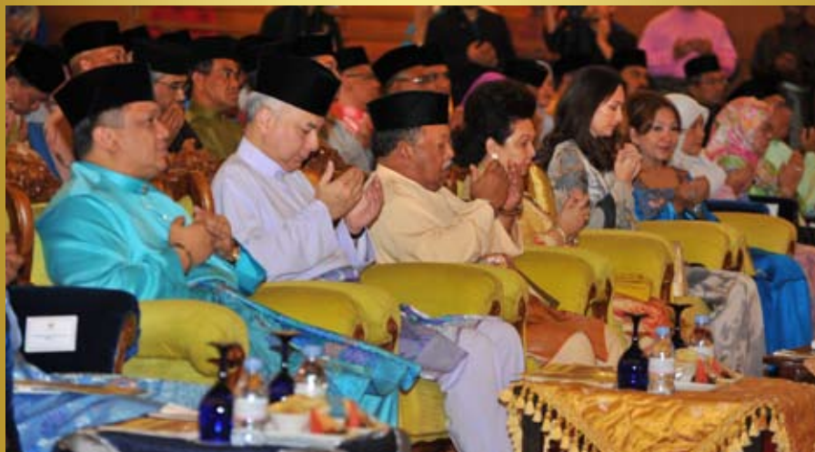
DYMM Tuanku Syed Sirajuddin ibni Al-Marhum Tuanku Syed Putra Jamalullail, DYMM Tuanku Raja Perempuan Perlis, Tuanku Fauziah binti Tengku Abdul Rashid, DYMM Pemangku Raja Perak, Tuanku Raja Dr. Nazrin Shah ibni Sultan Azlan Muhibbuddin Shah, DYMM Tuanku Zara Salim, DYTM Tuanku Syed Faizuddin Putra ibni Tuanku Syed Sirajuddin Jamalullail dan DYTM Tuanku Hajah Lailatul Shahreen Akashah Khalil sedang mengaminkan bacaan doa.