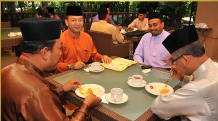
Ketua-ketua Jabatan sedang bersarapan pagi sebelum Seminar Institusi Raja (SIRaj) bermula di Lanai Kijang, Bank Negara, Kuala Lumpur pada 5 Jun 2013.