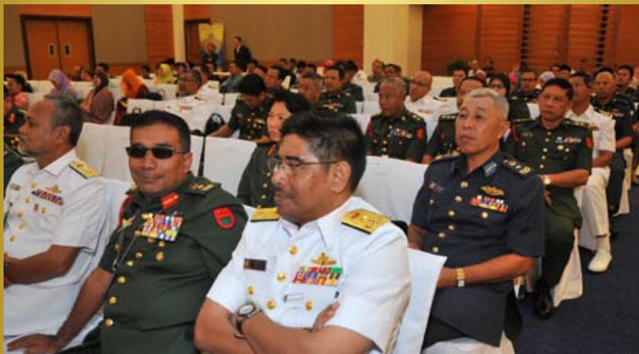
Antara para peserta yang hadir dalam Seminar Institusi Raja(SIRaj) di Lanai Kijang, Bank Negara, Kuala Lumpur pada 5-6 Jun 2013.