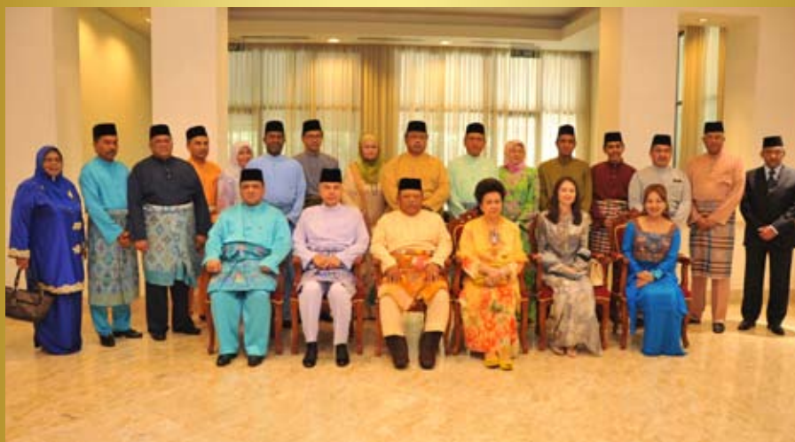
DYMM Tuanku Syed Sirajuddin ibni Al-Marhum Tuanku Syed Putra Jamalullail dan DYMM Tuanku Fauziah binti Tengku Abdul Rashid, DYMM Pemangku Raja Perak Tuanku Raja Dr. Nazrin Shah ibni Sultan Azlan Muhibbuddin Shah dan DYMM Tuanku Zara Salim, DYTm Tuanku Syed Faizuddin ibni Tuanku Syed Sirajuddin Jamalullail dan DYTm Tuanku Lailatul Shahreen Akashah Khalil berkenan mengabadikan kenangan bersama para pembesar negeri dan pelaksana SIRAJ.