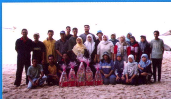
Sambutan Hari Keluarga di Pulau Pangkor

Tentunya perjalanan yang panjang penuh pelbagai masalah dan cabaran. Setidak-tidaknya dalam tempoh 7 tahun bekerja beliau telah memberi tunjuk ajar bagaimana caranya untuk menangani pelbagai masalah yang tidak kurang kecilnya semasa berurusan dengan kerendah pihak pembekal, para pelajar dan kakitangan yang tidak kurang hebatnya. Sejak dari mula bekerja, beliau telah menerapkan nilai-nilai murni yang perlu dikongsi bersama seperti perasaan kasih sayang, hormat-menghormati, saling bantu-membantu, berbudi bahasa supaya stafnya menjadi manusia yang bertanggungjawab dan tidak mementingkan diri sendiri.