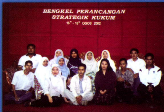
Bergambar kenangan sempena Bengkel Perancangan Strategik di Beringin Beach Resort

Selain melakukan tugas hakiki sebagai Pembantu Perpustakaan, saya juga telah bersama-sama dengan beliau melibatkan diri sebagai salah seorang AJK Jamuan bagi setiap majlis yang dianjurkan oleh UniMAP termasuklah dalam tugas saya yang pertama iaitu Majlis Pecah Tanah Kampus Tetap di Ulu Pauh pada 2003. Berbekalkan semangat dan ilmu yang dicurahkan oleh beliau, kami telah berjaya membantu melancarkan majlis tersebut bersama-sama dengan jayanya. Beliau selalu mengingatkan stafnya ketika menjadi AJK Jamuan bahawa "A hungry man is an angry man". Saban tahun kami juga akan mengadakan rumah terbuka sempena Aidilfitri. Tidak lupa juga Majlis Sambutan Hari Kelahiran untuk para staf.