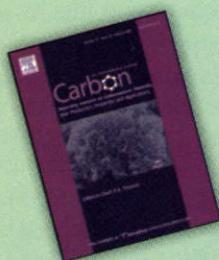
(ISSN : 0008-6223) Bilangan muat turun teks : 4554