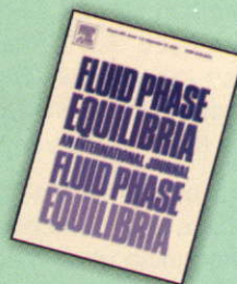
ISSN : 0378-3812) Bilangan muat turun teks : 2440