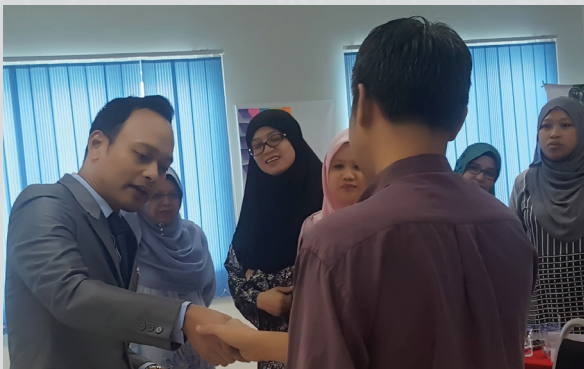
Kursus Pengurusan Protokol dan Etiket Sosial (2017)