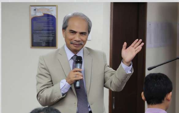
Seminar Transformasi Jurutera Pengajar (MTUN) 2017