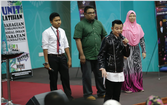
Seminar Pengacara Hebat 3 (2017)