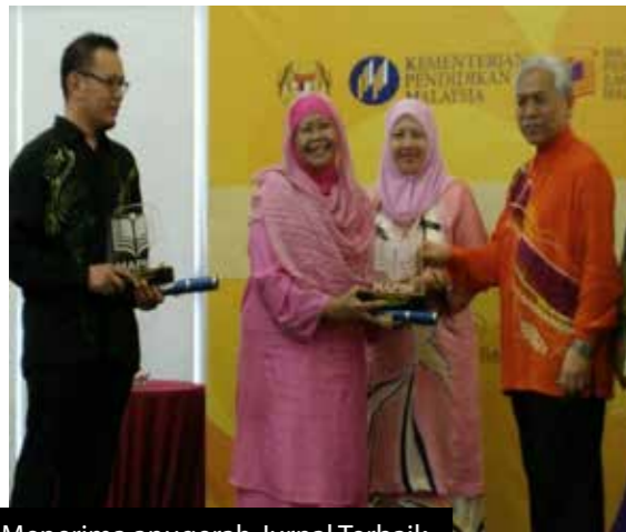
Menerima anugerah Jurnal Terbaik

Jika ada masa terluang, saya akan memasak dan memberikan sedekah walaupun sedikit kepada orang lain tidak kira siapa sahaja. Saya juga suka menghabiskan masa bersama anak dan cucu saya. Selain itu, saya cuba mencari masa untuk mengunjungi saudara mara, dan antara perkara yang paling saya suka lakukan ialah merayau-rayau pergi ke pasar-pasar malam, pasar pagi dan jika berkelapangan saya suka menghabiskan masa di taman herba dan bunga saya di Bangi. Kadangkala saya sempat juga melayari Facebook dan WhatsApp... Ha ha ha. Saya menganggap melalui penulisan kreatif seperti menulis skrip dan puisi merupakan tugas serta tanggungjawab saya.