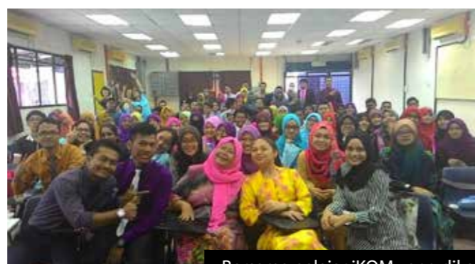
Bersama pelajar iKOM yang dikasihi