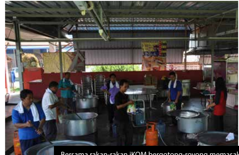
Bersama rakan-rakan iKOM bergotong-royong memasak bubur lambuk