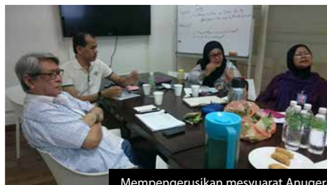
Mempengerusikan mesyuarat Anugerah