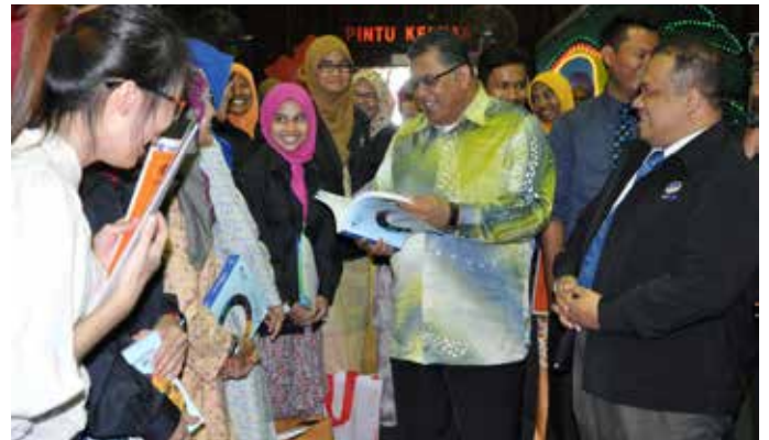
Sesi ramah mesra Ybhg. Datuk NC bersama pelajar.