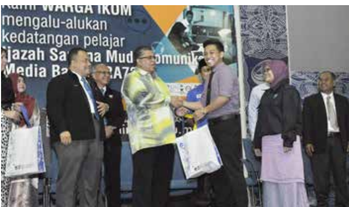
Pelajar menerima cenderahati dari Ybhg. Datuk NC.