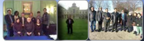
Menghadiri latihan "Certificates of Occupational Test Use- Level A and B pada 9- 14 Disember 2013 di University of Cambridge, United Kingdom

Kursus ini telah berlangsung di universiti ulung, Cambridge