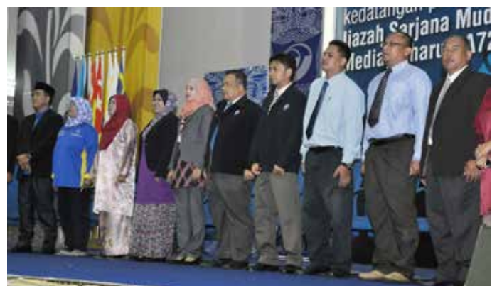
Dekan, Exco iKOM serta tenaga pengajar Ijazah Sarjana Muda Komunikasi Media Baharu RA72.