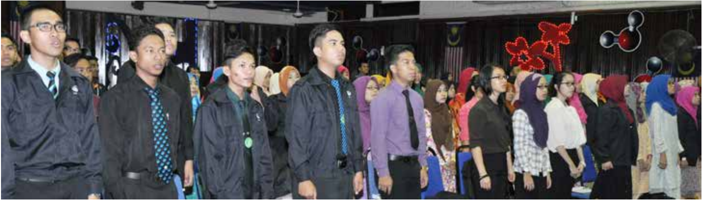
Pelajar baru bersemangat melaungkan lagu kebangsaan, Negaraku.