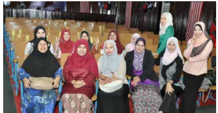
Warga iKOM bersemangat menerima orang baru ke Pusat Pengajian.