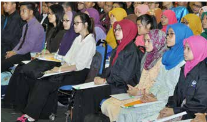
Pelajar tekun mendengar taklimat yang disampaikan.