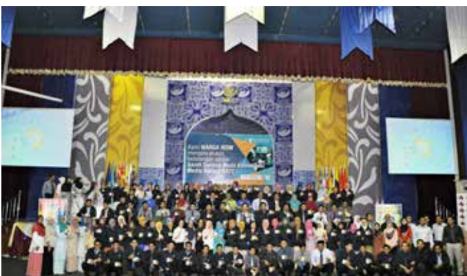
Warga iKOM 2014.