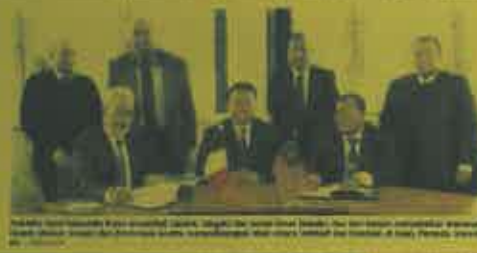
... (caption text) ...