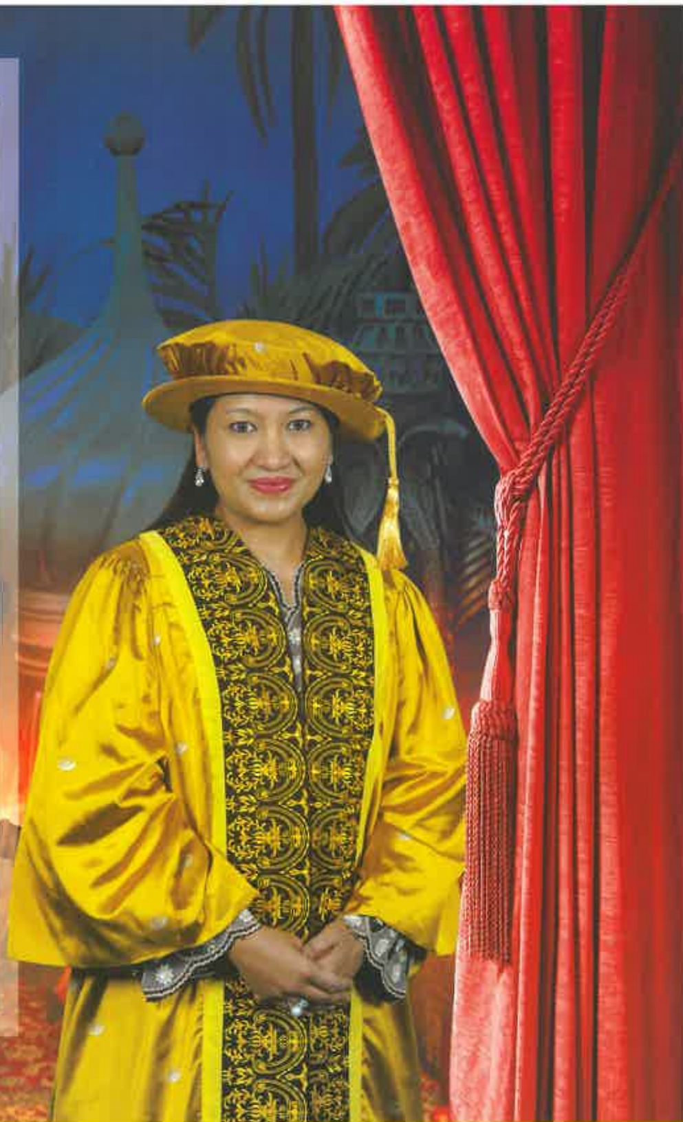
DULI YANG TERAMAT MULIA TUANKU HAJAH LAILATUL SHAHREEN AKASHAH KHALIL S.P.M.P., Honoris Causa in Health Sciences (Universidad Nacional Pedro Henríquez Ureña, DR) Raja Puan Muda Perlis Pro Canselor UniMAP