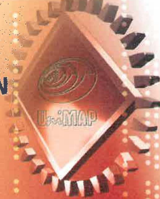
Latihan Industri Pada Tahun 2006/2007 Mengikut Program Pengajian / Industrial Training For Year 2006/2007 by Academic Program