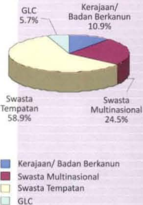
Latihan Industri Pada Tahun 2007/2008 Mengikut Industri