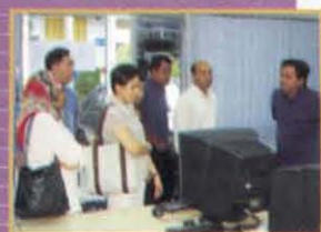
Lawatan Infineon & NCER