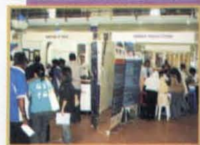
Karnival Kerjaya 2008