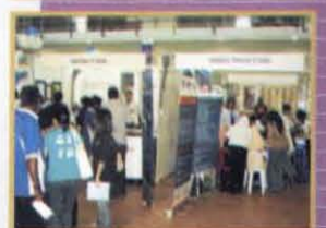
Karnival Kerjaya 2008