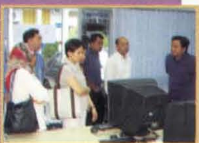
Lawatan Infineon & NCER