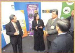
Majlis Penyampian Sijil Program AUDP 2008