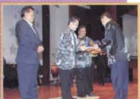
Majlis Makan Malam Bersama Industri