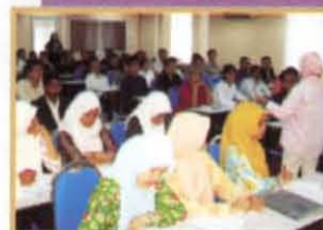
Program Career Talk oleh Syarikat Infineon Kulim