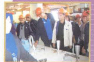
Lawatan Pelajar UniMAP ke SIRIM