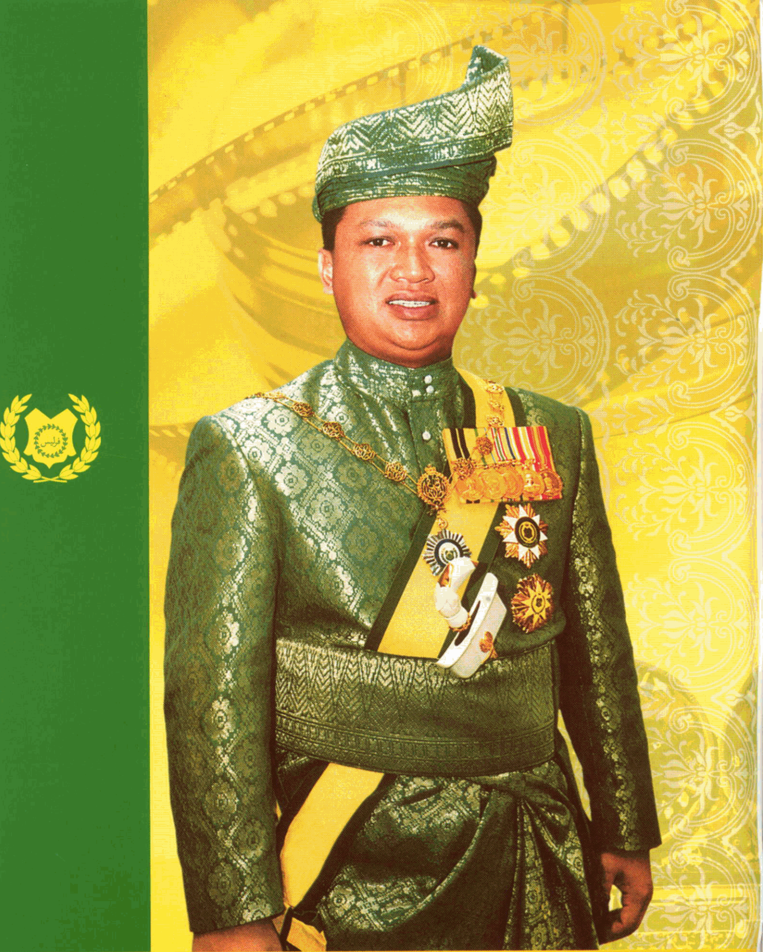
DULI YANG MAHA MULIA TUANKU SYED FAIZUDDIN PUTRA IBNI TUANKU SYED SIRAJUDDIN JAMALULLAIL D.K., S.P.M.P.