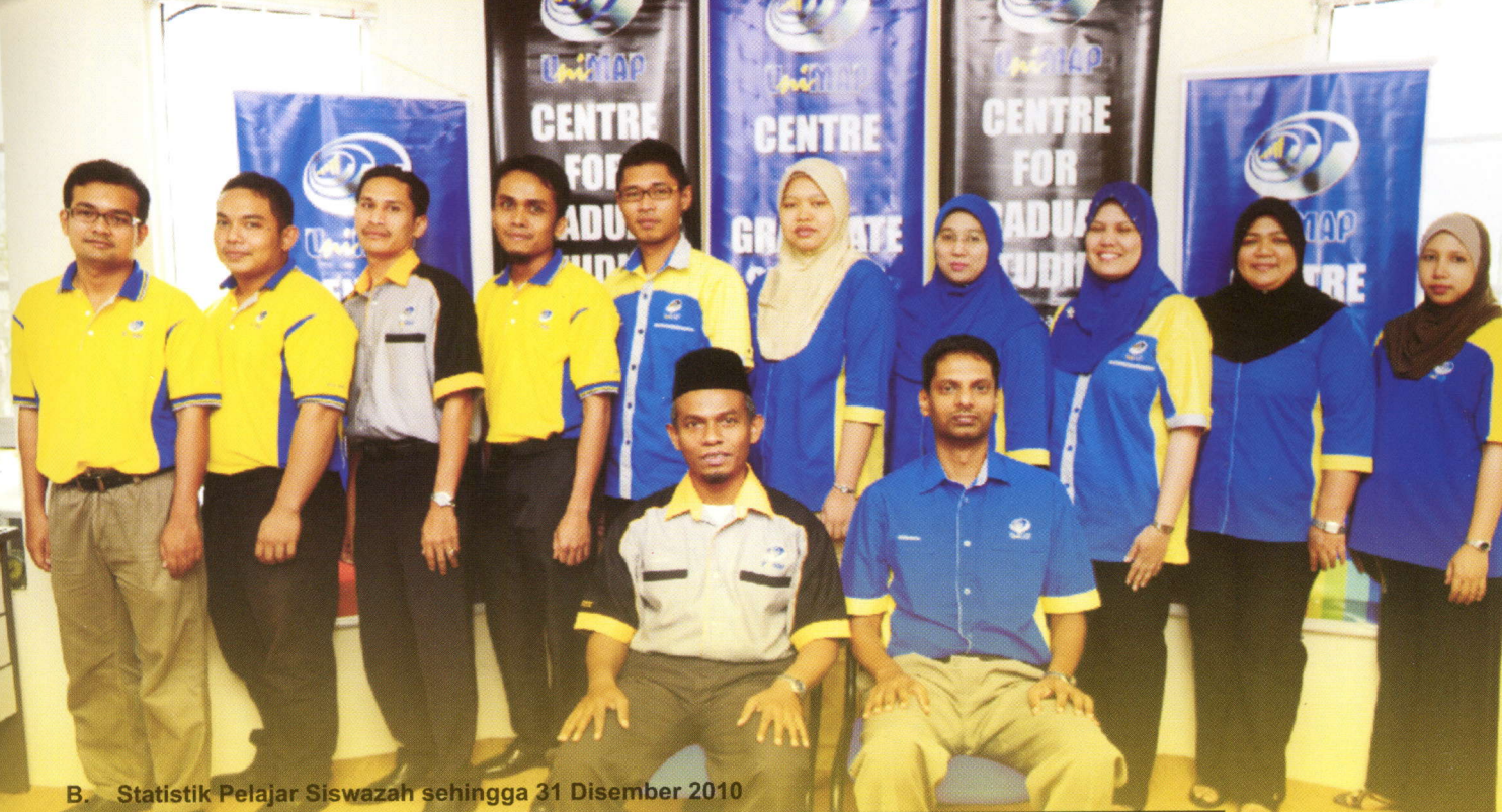
B. Statistik Pelajar Siswazah sehingga 31 Disember 2010