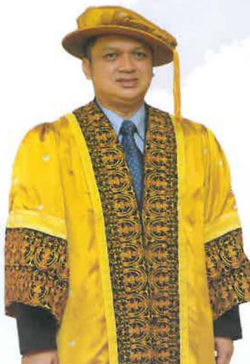
DTYM Tuanku Syed Faizuddin Putra Ibn Tuanku Syed Sirajuddin Jamalullail Chancellor Universiti Malaysia Perlis