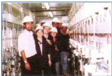
Lawatan ke Industri