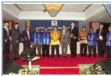
Majlis Menandatangani MoU Antara KUKUM Dengan First Guardian Pty Ltd, Full Base Union Co. Ltd, Power Solar Co. Ltd, Klapa Biotech Industries Sdn. Bhd, Marditech Corporation Sdn. Bhd, Flex P Industries Sdn Bhd, Symmid Corporation Sdn Bhd