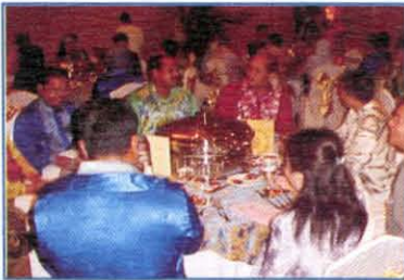
Majlis Malam Bersama Industri Di Kuala Lumpur Pada Tahun 2005