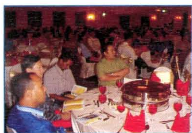
Majlis Malam Bersama Industri Di Pulau Pinang Pada Tahun 2005

"Industrial training shall be for a minimum of a two month duration to qualify for consideration under the related subjects. Credit hours allowed are 2 credit hours for the first two months and 2 credit hours per month for the following months, subject to a maximum of 6 credit hours. The training shall be adequately structured, supervised and recorded in logbooks/reports."