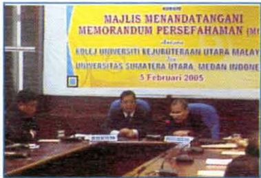
Majlis Menandatangani MoU Antara KUKUM Dengan Universitas Sumatera Utara