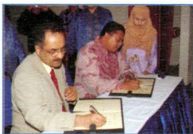
Majlis Menandatangani MoU Antara KUKUM Dengan Coventry University Higher Education Corporation