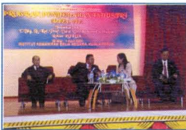
Program IndEx 2005