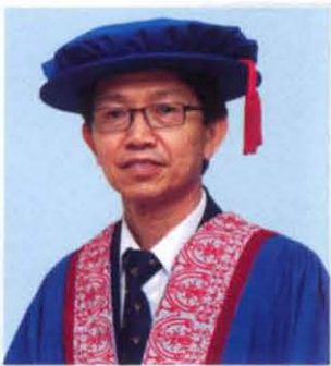
Y. BHG. IR. DR. GUE SEE SEW Ketua Pegawai Eksekutif, G&P Professionals Sdn Bhd. (Berkuatkuasa 1 September 2010)