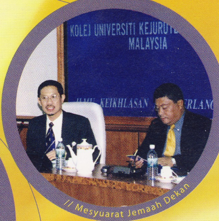
// Mesyuarat Jemaah Dekan