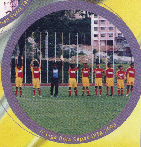
// Liga Bola Sepak IPTA 2003