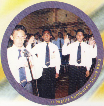
// Majlis Sambutan Siswa Baru