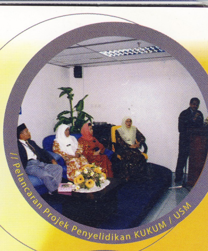
// Pelancaran Projek Penyelidikan KUKUM / USM