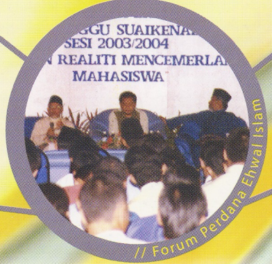
// Forum Perdana Ehwal Islam