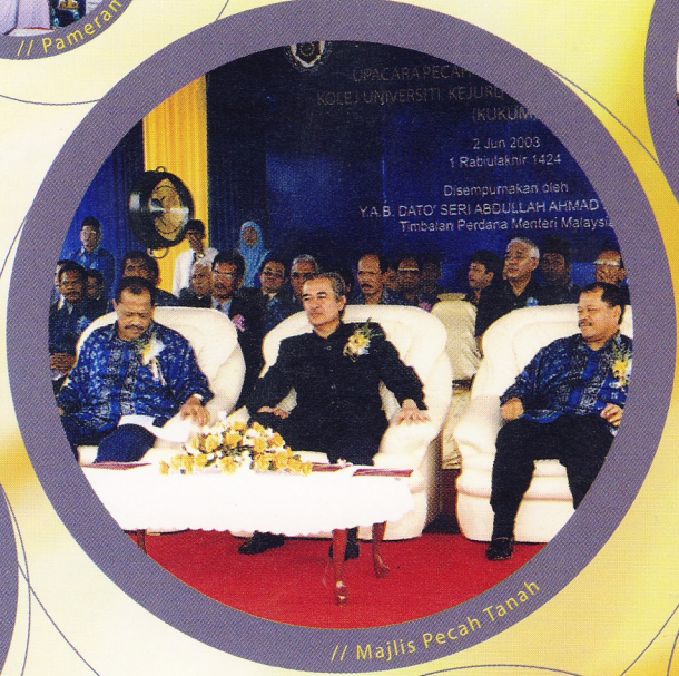
// Majlis Pecah Tanah