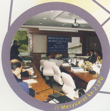
// Mesyuarat ke-2 LPU