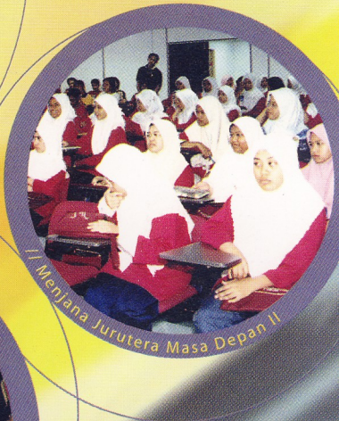
// Menjana Jurutera Masa Depan II