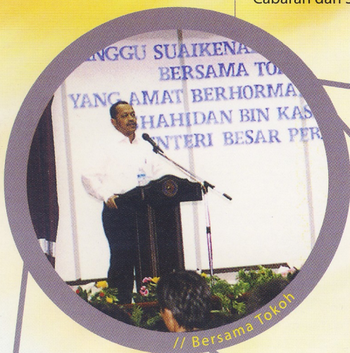
// Bersama Tokoh