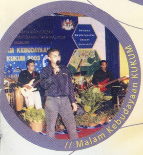
// Malam Kebudayaan KUKUM