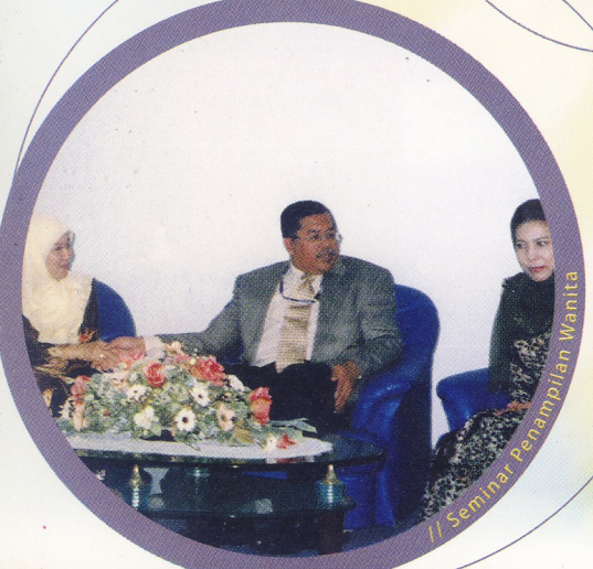
// Seminar Penampilan Wanita