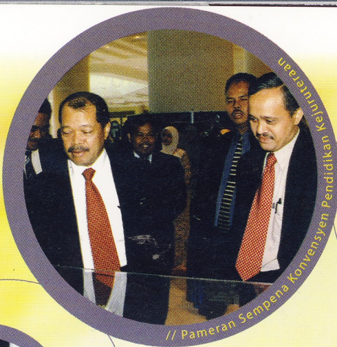
// Pameran Sempena Konvensyen Pendidikan u Kejuruteraan / USM