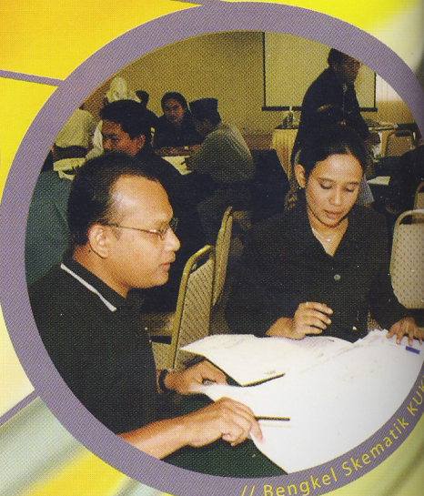
// Bengkel Skematik KUKUM