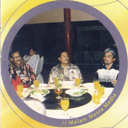
// Malam Mestra Media