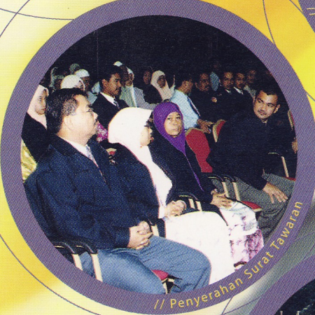
// Penyerahan Surat Tawaran