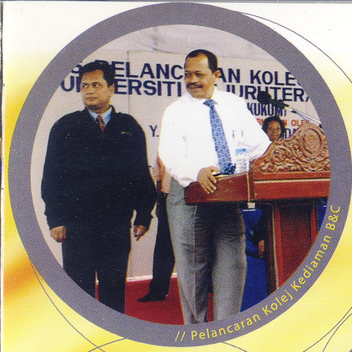
// Pelancaran Kolej Kediaman B&C