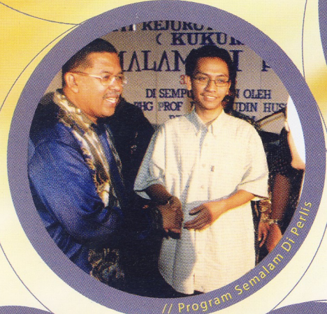
// Program Semalam Di Petits