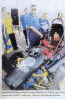
Tim UNIMAP1 dalam pertandingan UniART1 di Melaka.